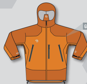
GIACCA ARGON UOMO

I capi esterni GORE-TEX® Soft Shell, studiati appositamente per ridurre il bisogno di sovrapporre più strati, offrono una migliore libertà di movimento. Morbidi, flessibili e caratterizzati da una durevole impermeabilità e traspirabilità - foderati in morbido fleece.