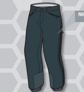
PANTALONI MANEUVER™ UOMO