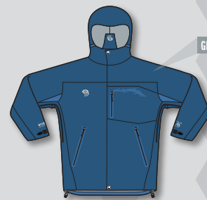
GIACCA XENON UOMO