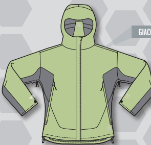
GIACCA TYPHOON DONNA